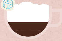
CAFÉ VIENNOIS 5,00€