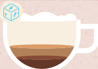
MACCHIATO AROMATISÉ 5,00€

Spéculoos, Noisette, Vanille Caramel, Cookies